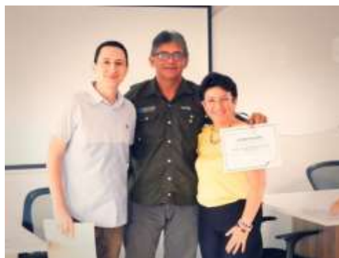
Foto de entregas de certificados de los cursos de Emprendedurimo y Gestión Empresarial para PYMES con CENDAS.