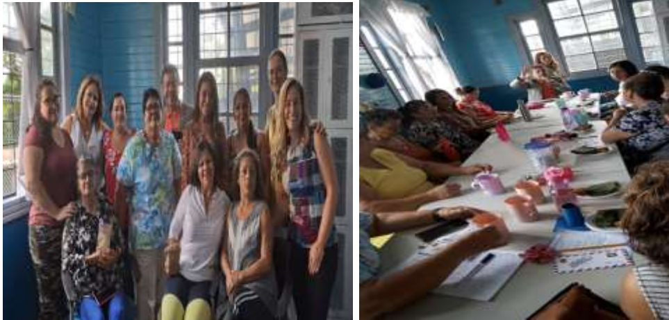
Creando con mis manos