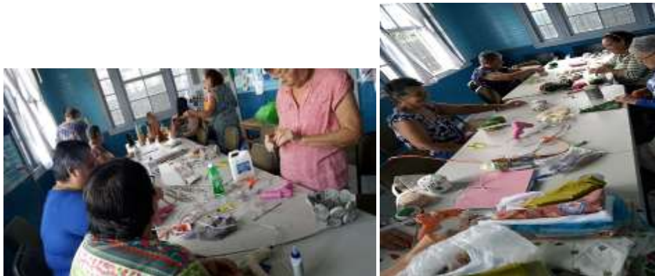
Casitas de escucha