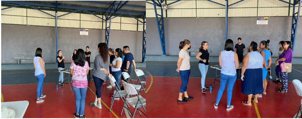
Reunión con encargado de estudiantes.