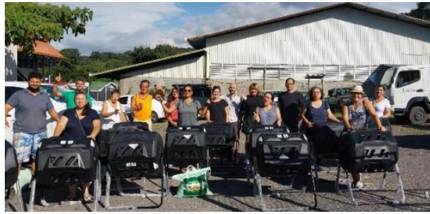
Mercado de abasto solidario