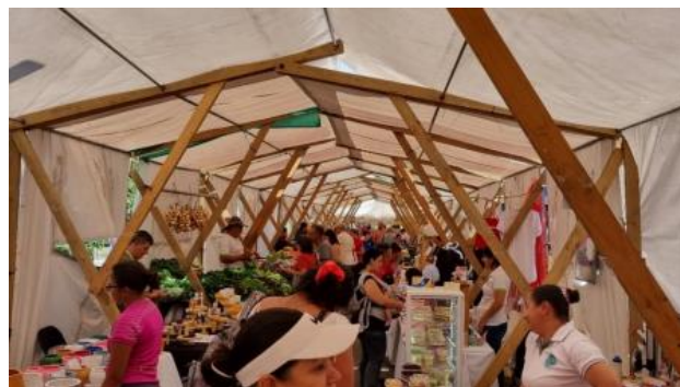
Practica Agrícola sostenible